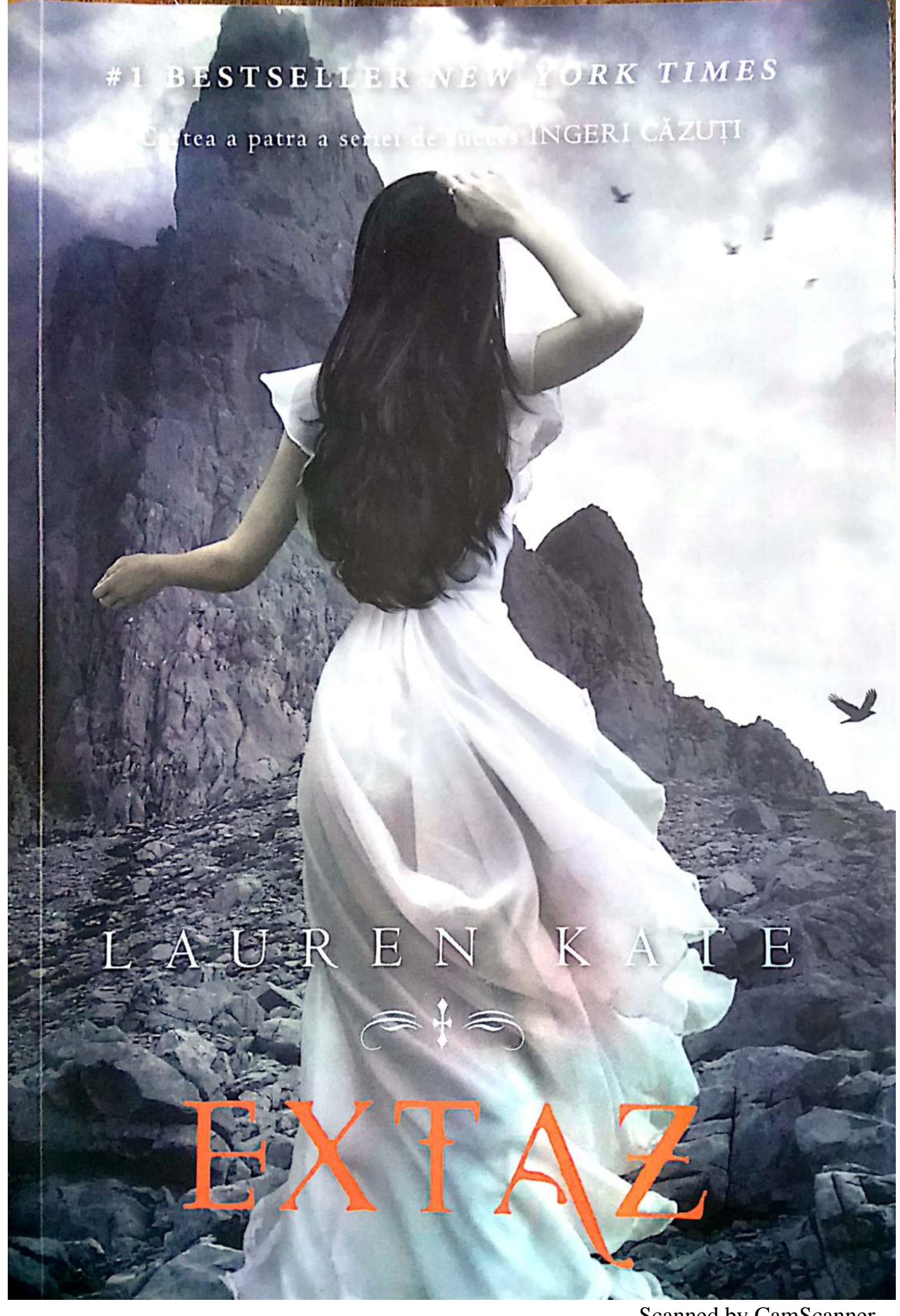
Scanned by CamScanner