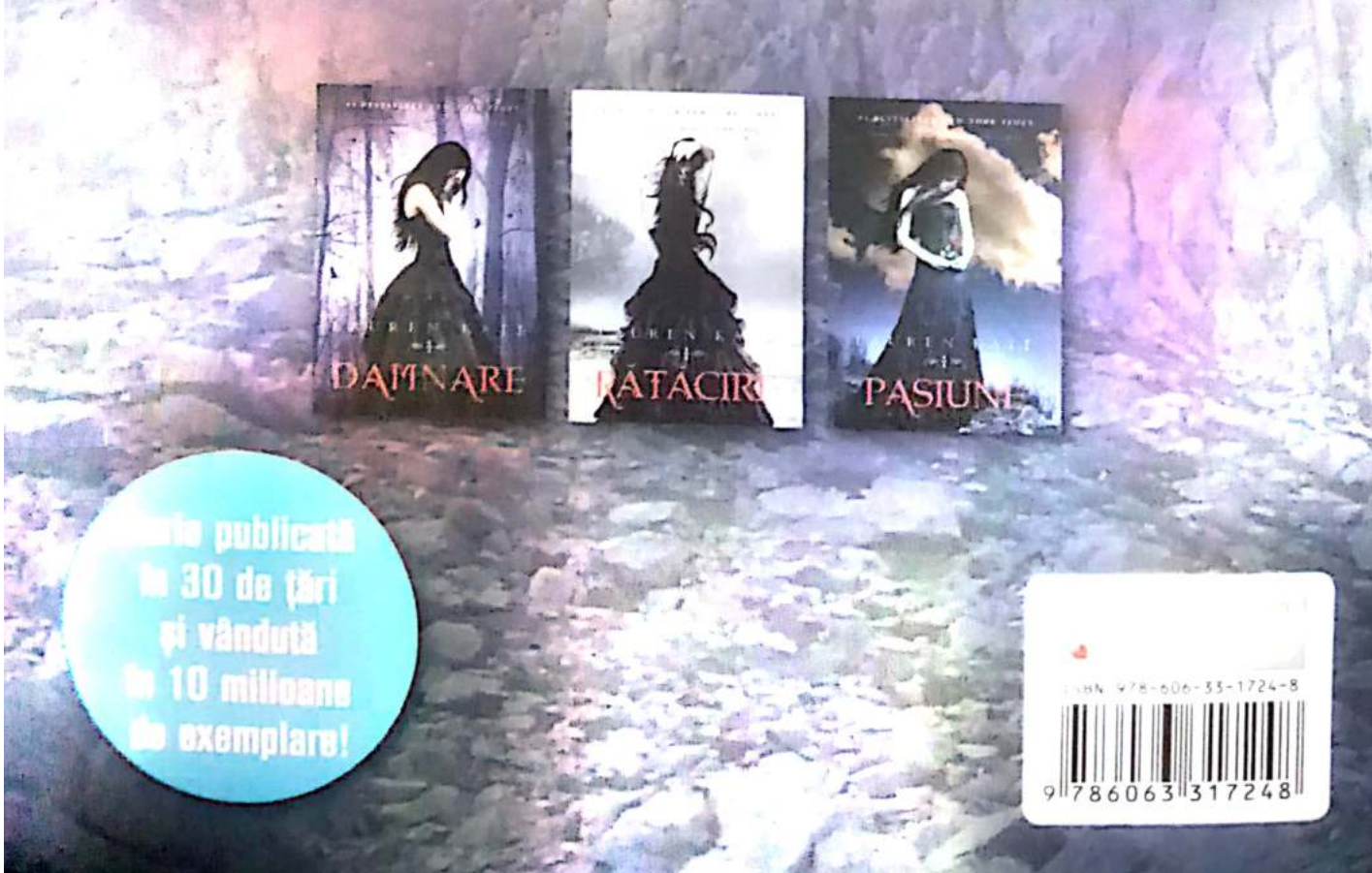
Scanned by CamScanner